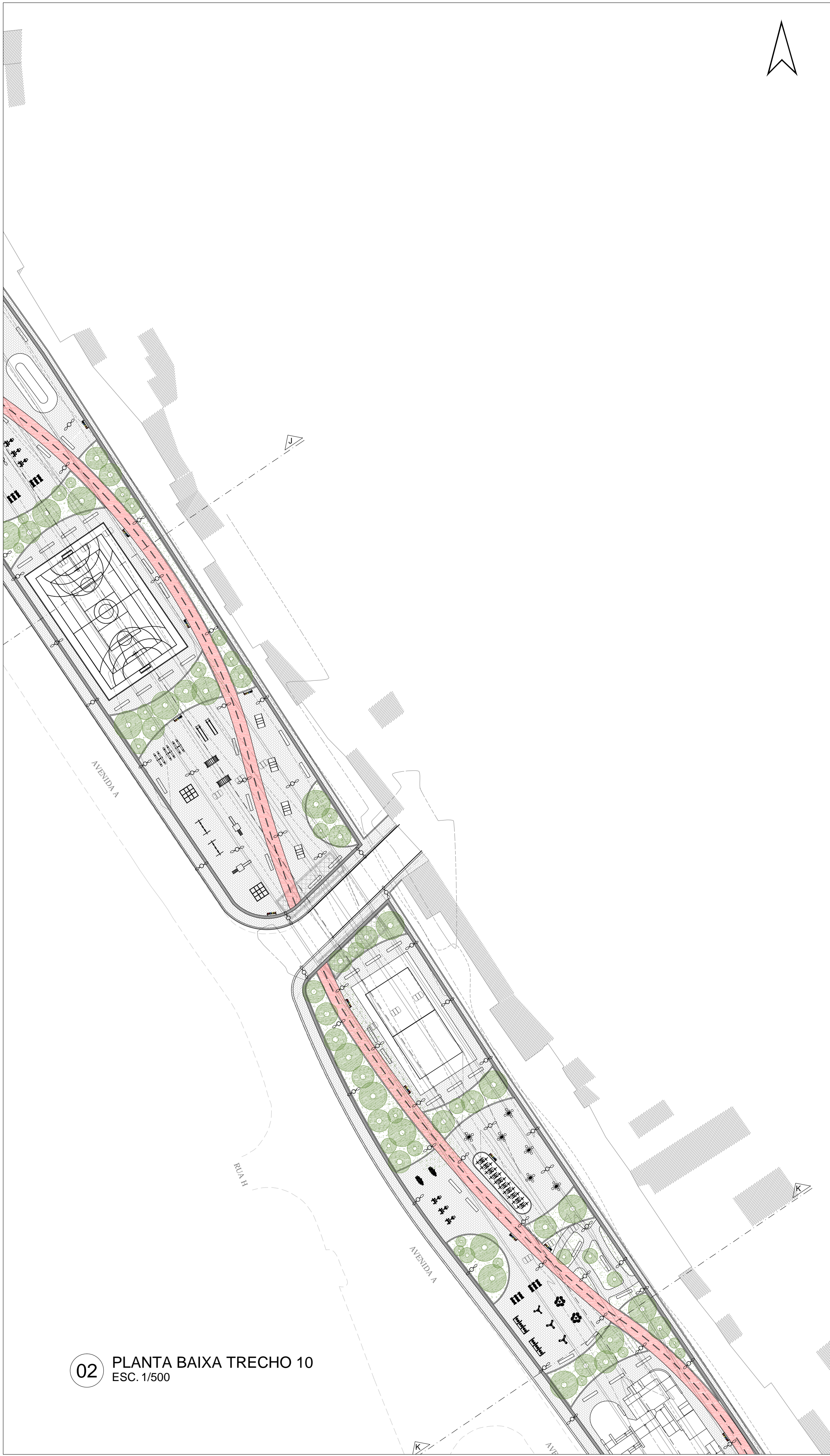
02 PLANTA BAIXA TRECHO 10 ESC. 1/500