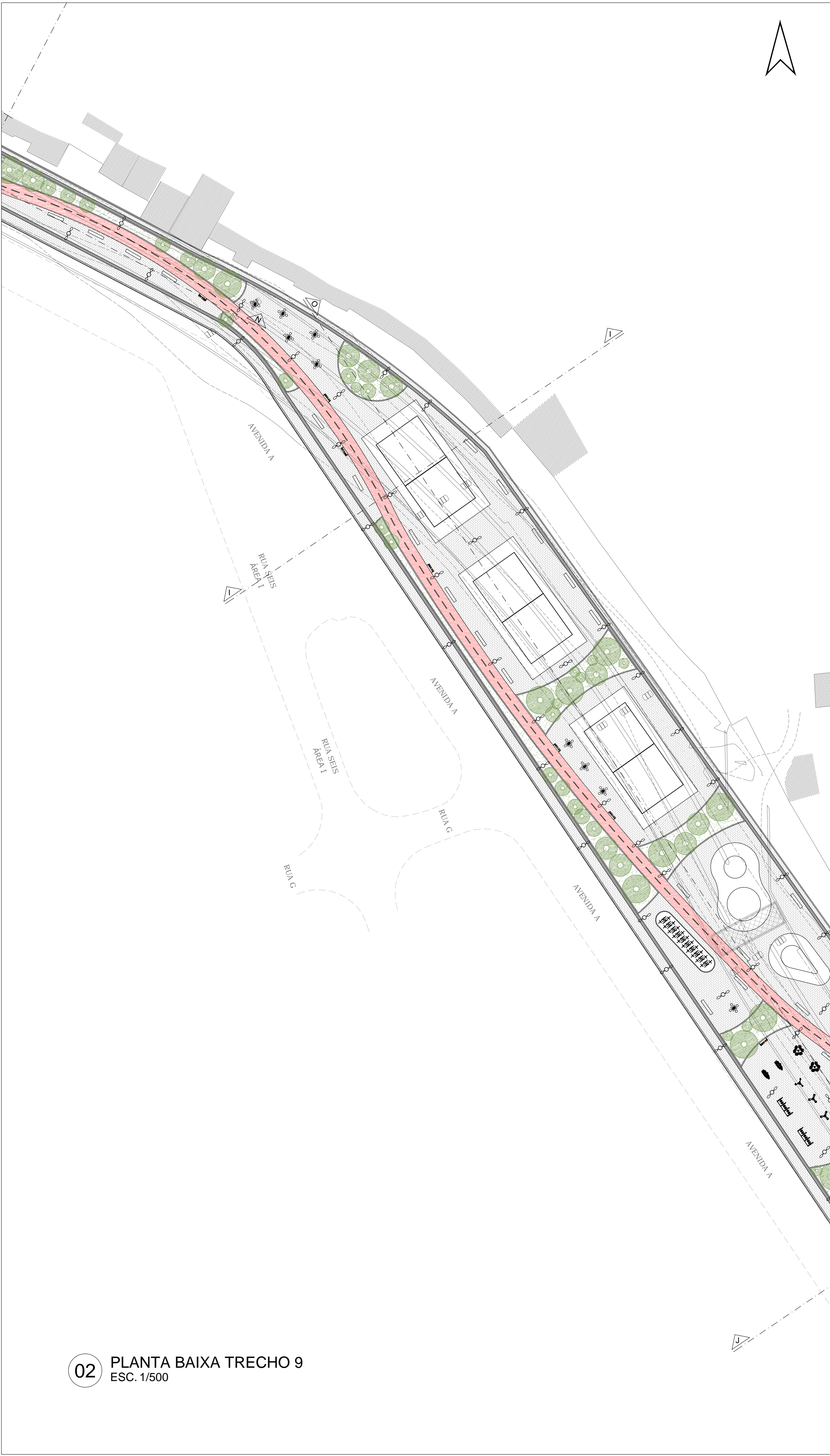
02 PLANTA BAIXA TRECHO 9 ESC. 1/500