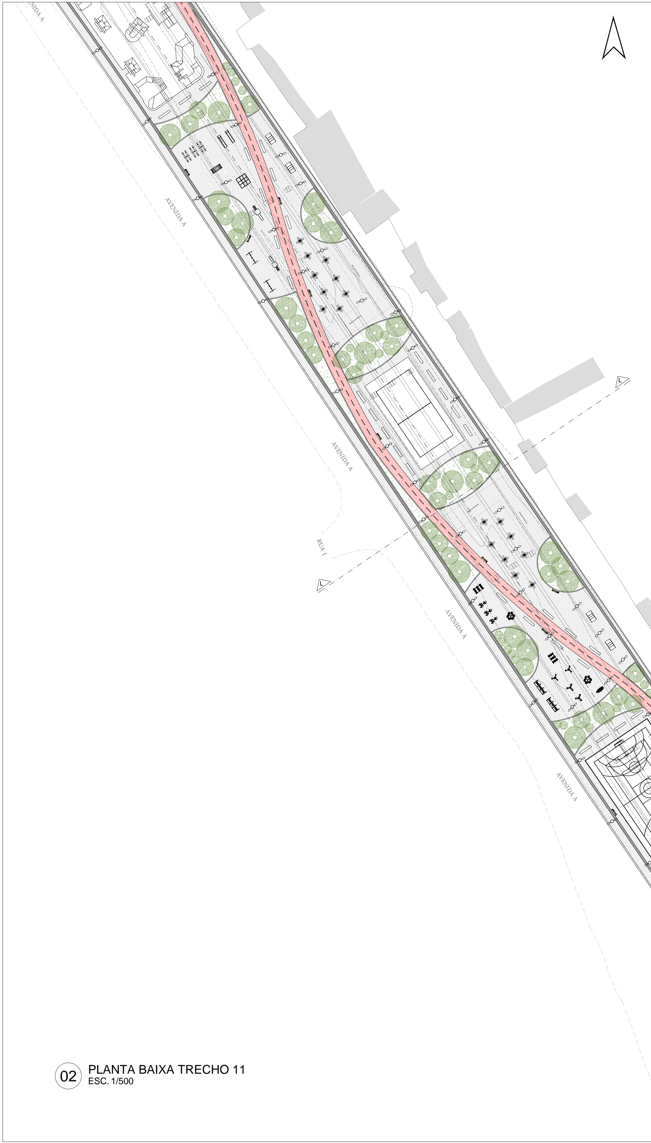
02 PLANTA BAIXA TRECHO 11 ESC. 1/500